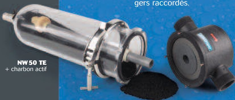
NW 50 TE + charbon actif

Vendu séparément, le charbon actif CINTROPUR® SCIN supprimera les goûts et les odeurs de l'eau. Il réduira le chlore et les micro-polluants tels les pesticides et les substances organiques dissoutes.